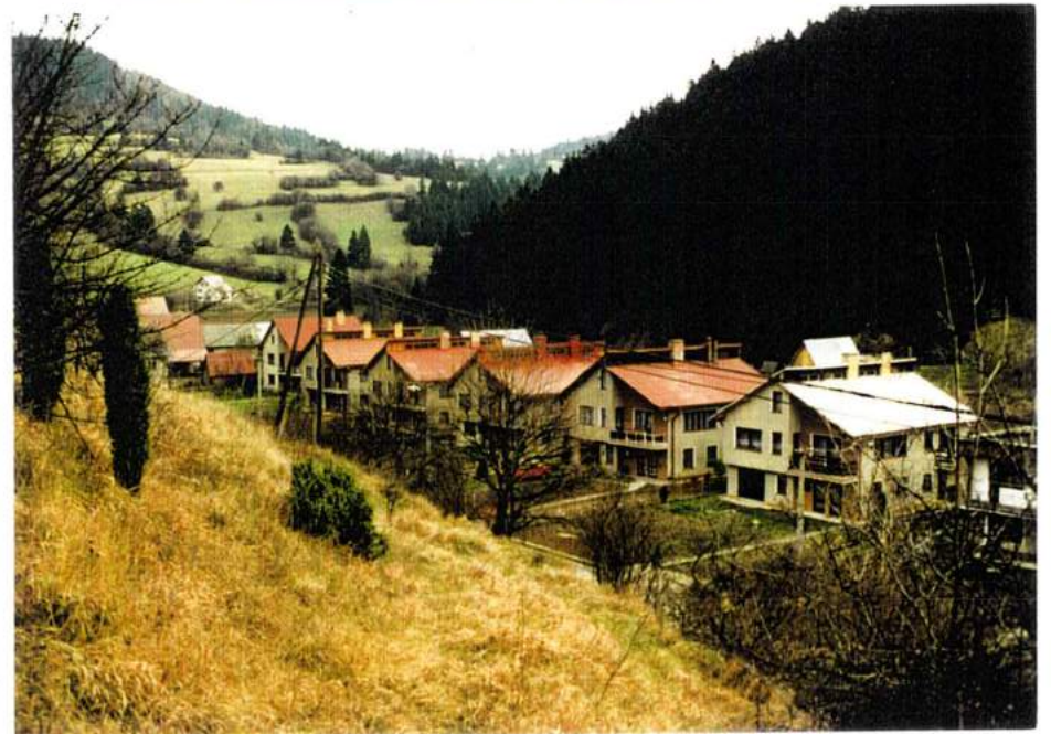
STARÁ ČASŤ OBCE