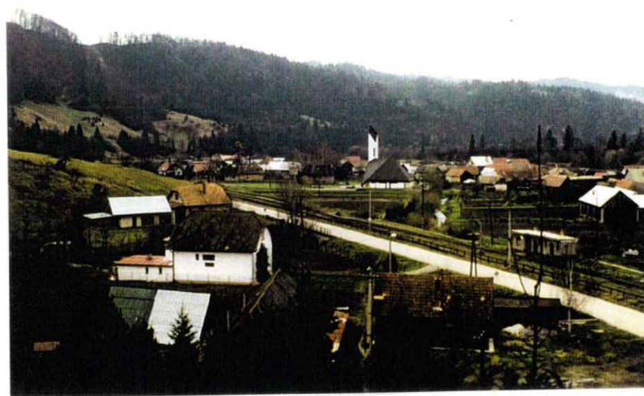
O B E C S D O M I N A N T O U – K O S T O L O M