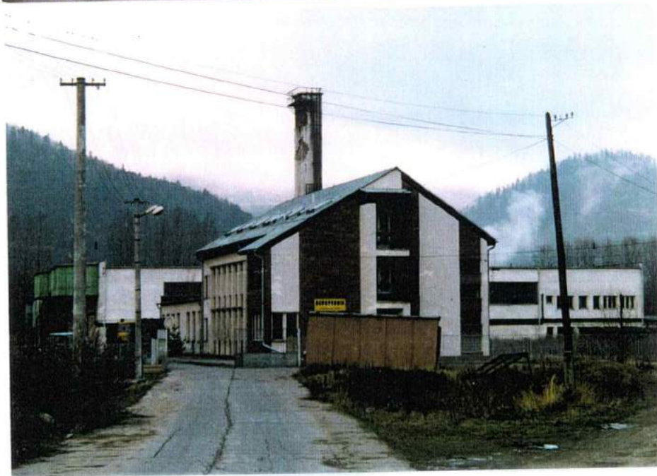
A G R O P O D N I K