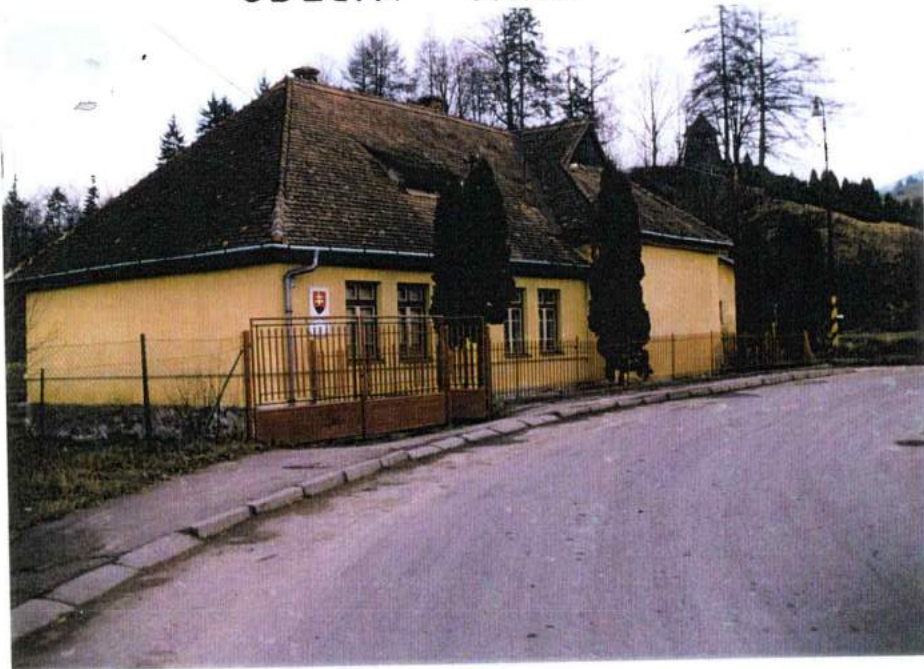
O B E C N Ý Ú R A D